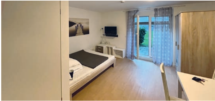
Breslauer Straße 1 e

Auf der Suche nach einer komfortablen Übernachtungsmöglichkeit? Dann legen wir Ihnen unsere beiden Gästewohnungen ans Herz. In der Breslauer Straße 1 e können bis zu zwei Personen unterkommen, während die Gästewohnung in der Beckershoffstraße 1 für maximal vier Personen ausgelegt ist.